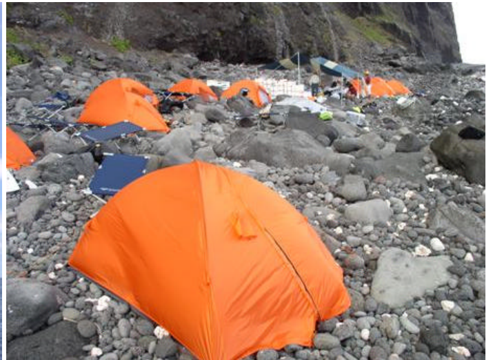
BC風景 (巨石 & 玉石の海岸)