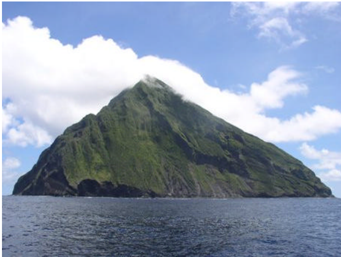
南硫黄島全景 (北側)