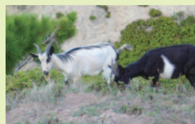
固有植物を食べるノヤギ

人によって他の土地から持ち込まれた外来種の影響により、小笠原固有の生きものの数が急激に減っています。現在、本来の生態系を取り戻すために、関係機関と地域住民が協力しながら、外来種を排除する取組みが進められています。