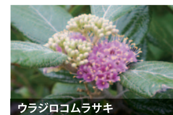
ウラジロコムラサキ

一つの花に雄しべと雌しべがある花を「両性花」といいます。小笠原では、もともと両性の花を咲かせる植物が、独自の進化を遂げて、オスの花をつける株とメスの花をつける株に分かれるよう進化したものがあります。これは、安全に多様な子孫を残すための工夫だと考えられています。