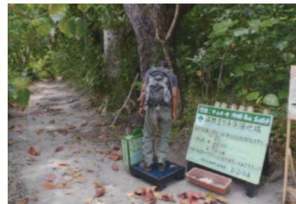
遊歩道入り口での外来種除去

山の中や他の島に行くときに、靴の裏や服、荷物に、種や小さな虫などがくっついたりまぎれ込んだりしていないかチェックするようにしましょう。