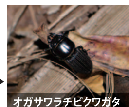
オガサワラチビクワガタ