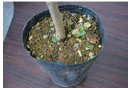
土の中に含まれる雑草

日本の本土から小笠原に広がるおそれのある、植物や動物、土や土のついた苗などを持ち込まないようにしましょう。