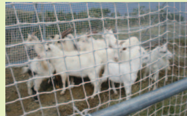
追い込みによるノヤギの捕獲