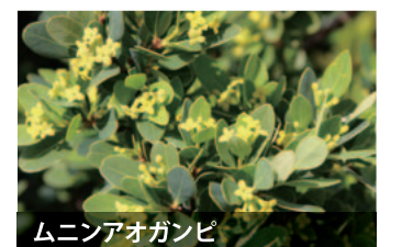
ムニンアオガンビ