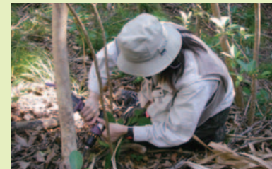
薬剤注入による枯殺