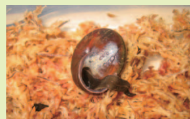
陸産貝類を食べるニューギニアヤリガタリクスムシ