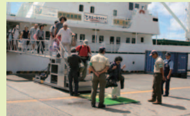
靴裏洗浄による拡散防止(母島沖港)