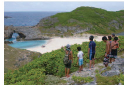
エコツアーリズムの様子(南島)

遊歩道やきめられたルートの利用ルールを守り、ルートから踏み出さないようにしましょう。