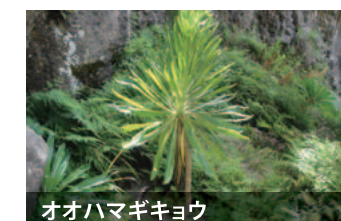
オオハマギキョウ

もともと草である植物が、海洋島という特殊な環境の中で、木へと進化することがあります。小笠原諸島では、キキョウの仲間であるオオハマギキョウ、キクの仲間であるワダンノキ、ヘラナレン、ユズリハワダンが草から木へと進化しました。