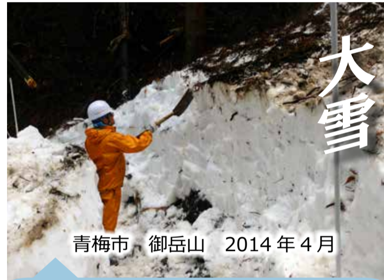
青梅市 御岳山 2014年4月

2014年2月の記録的大雪により、御岳山ロックガーデンには4月まで雪が残り、除雪作業を行いました。