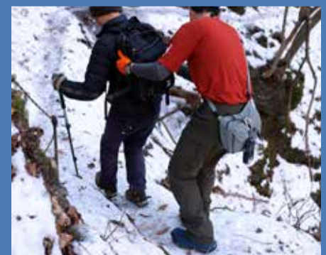
アイゼンを持っていない人を補助する都レンジャー