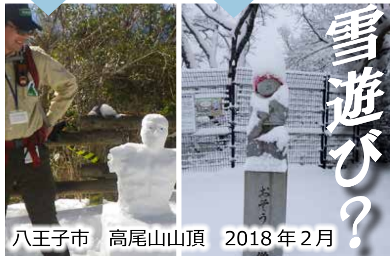
八王子市 高尾山山頂 2018年2月