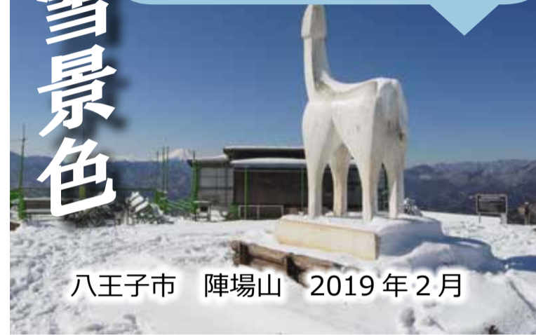
八王子市 陣場山 2019年2月

2018年に払沢の滝が完全凍結した写真。表面は凍っていますが、氷の下に水が流れています