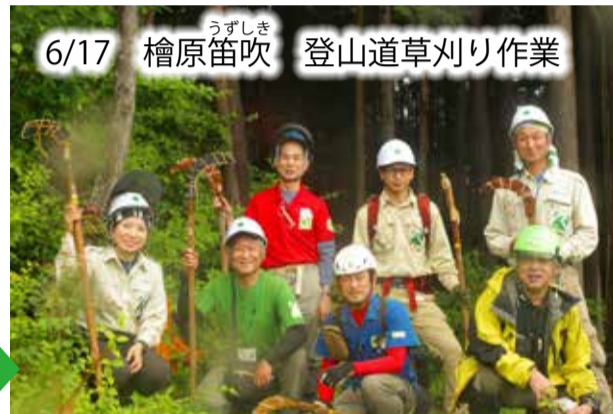
6/17 檜原 うずしき 笛吹 登山道草刈り作業