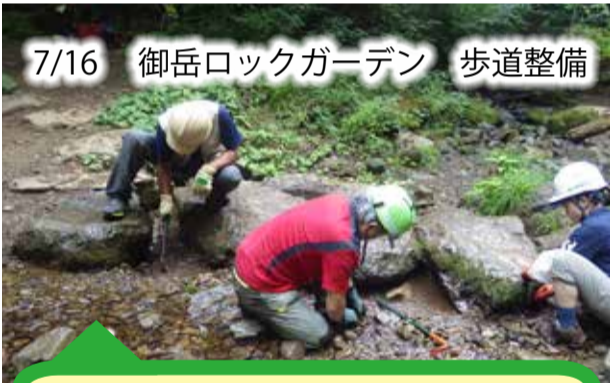
7/16 御岳ロックガーデン 歩道整備

登山道上のウッドデッキに堆積した土砂を除去し、歩きやすくする為の作業を行いました。