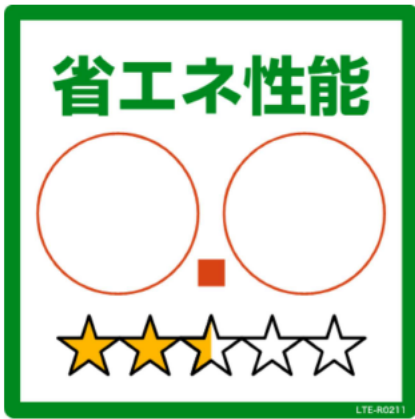
別添 3 - 1