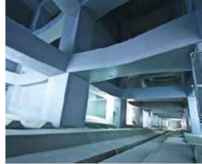
＜芝浦水再生センター 雨天時貯留施設＞