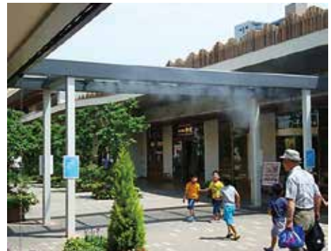
<ドライ型（微細）ミストの導入事例>