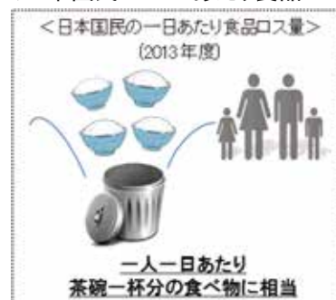
＜日本国民の一日あたり食品ロス量＞