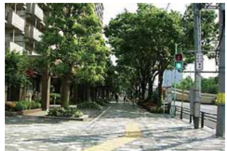
<街路樹による木陰のある空間>