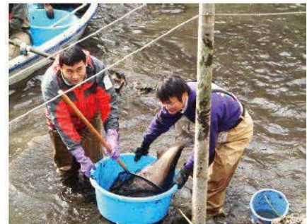
＜公園における生物の 保全・育成活動(かいぼり)＞