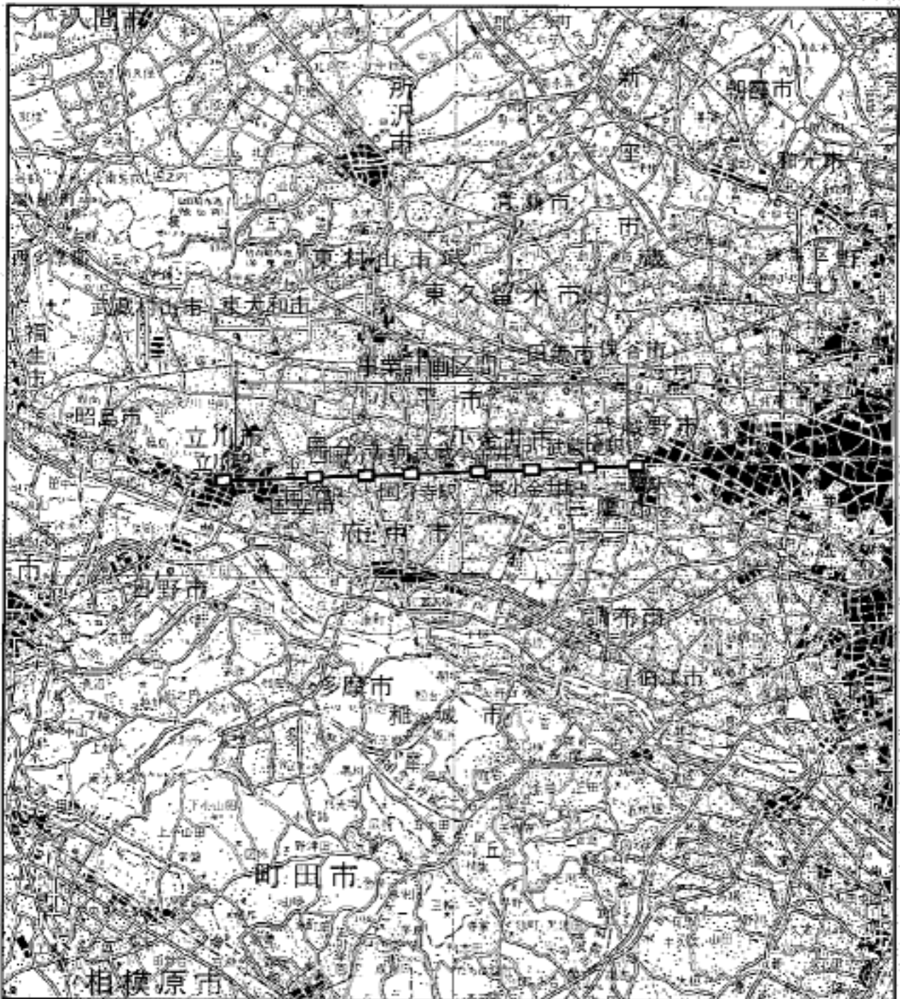
図 1 - 3 - 1 事業計画区間位置図