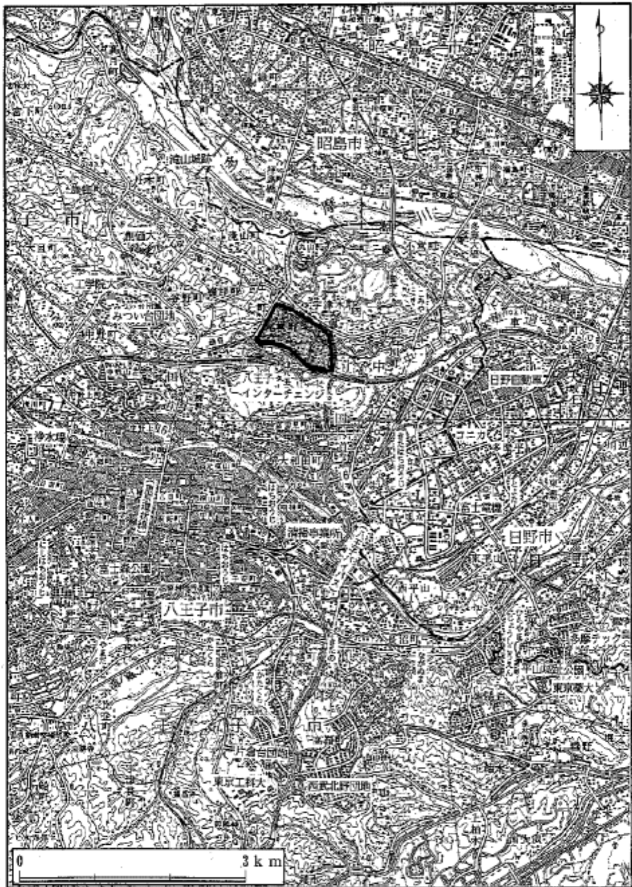
図2.2-1 計画区域周辺の状況